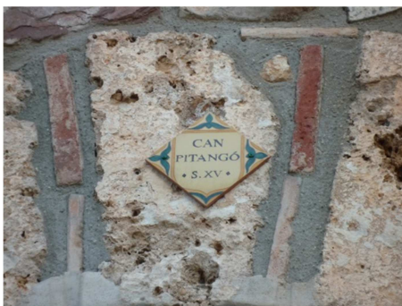
Rajola amb el nom de l'hostal.

Cal Pitangó es considera una obra popular, feta per la gent del poble.