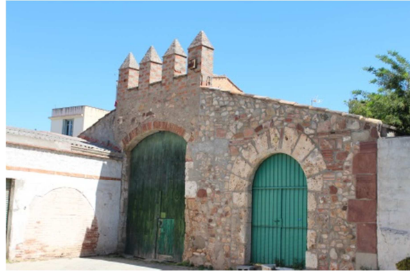
Porta principal de l'hostal de Cal Pitangó.