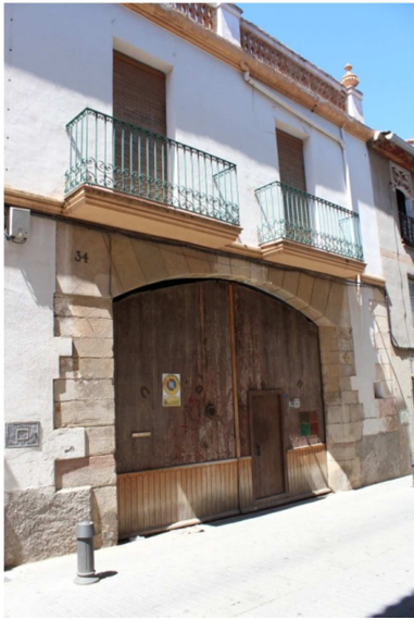
Antiga porta de l'hostal de Cal Pitangó.