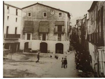
Plaça de l'Ajuntament

La plaça de l'ajuntament va ser el nucli del poble ja que es creuaven el carrer de les Hortes, el carrer Gran i el carrer Cavallers. En aquesta plaça es feia el mercat on s'hi trobaven els mercaders i els comerciants i era el lloc on hi passava més gent en tot el poble.